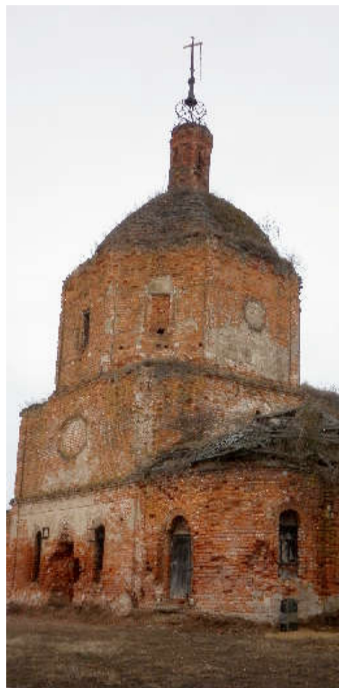
Село Гришово 2019 год.

В Лисках все бурлило. Разгружались многочисленные эшелоны, маршировали отряды красноармейцев, слышались песни. В тупиках стояли вагоны с наименованием различных формирований и частей. На некоторых вагонах